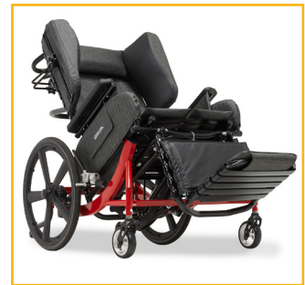
L'inclinaison du siège à pivot avant maintient une de vue vers l'avant, favorisant l'interaction sociale / l'échange