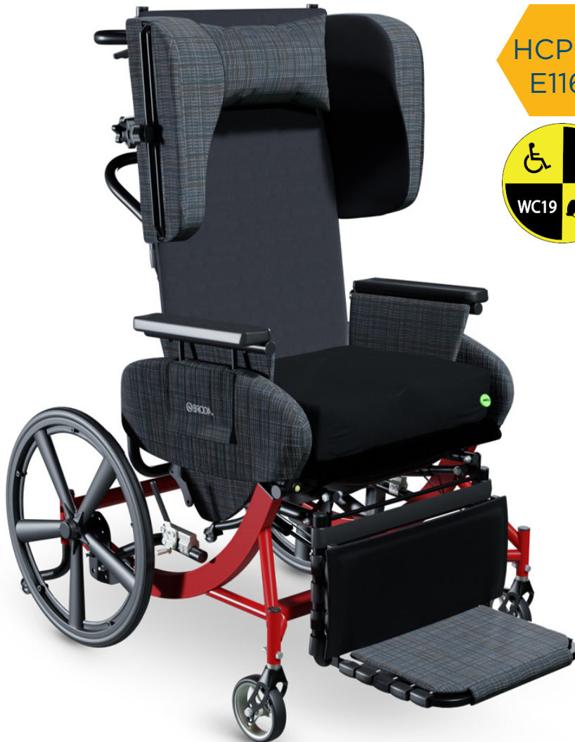
Shown with rear 20" mag wheels and Matrix PS Cushion