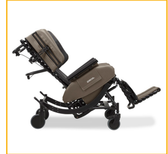
Le mécanisme d'inclinaison facilite le repositionnement des utilisateurs