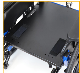
Le plateau solide de siège permet d'accueillir de nombreux sièges.