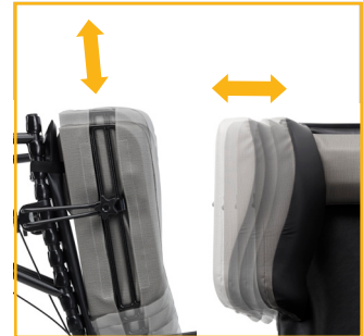
Le fauteuil est pourvu d'appuis latéraux réglables pour convenir à toute une variété d'utilisateurs.